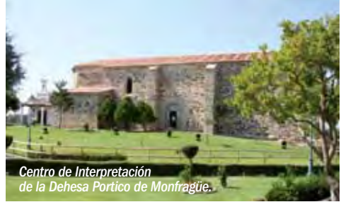
Centro de Interpretación de la Dehesa Pórtico de Monfragüe.