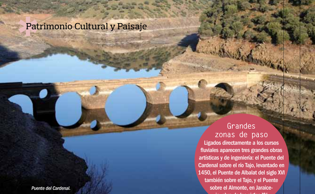
Puente del Cardenal.

Grandes zonas de paso Ligados directamente a los cursos fluviales aparecen tres grandes obras artísticas y de ingeniería: el Puente del Cardenal sobre el río Tajo, levantado en 1450, el Puente de Albalat del siglo XVI también sobre el Tajo, y el Puente sobre el Almonte, en Jaraicejo, obra de los siglos XV y XVII.