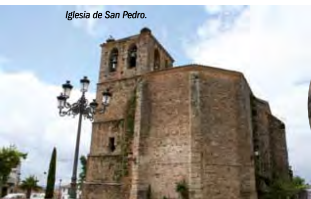
Iglesia de San Pedro.

En el conjunto de poblaciones destacan las iglesias de estilo gótico-renacentista, de gran calidad artística (cuatro de ellas declaradas Bien de Interés Cultural), levantadas la mayoría bajo el mecenazgo de la singular figura del Obispo de Plasencia Gutierre de Vargas y Carvajal.