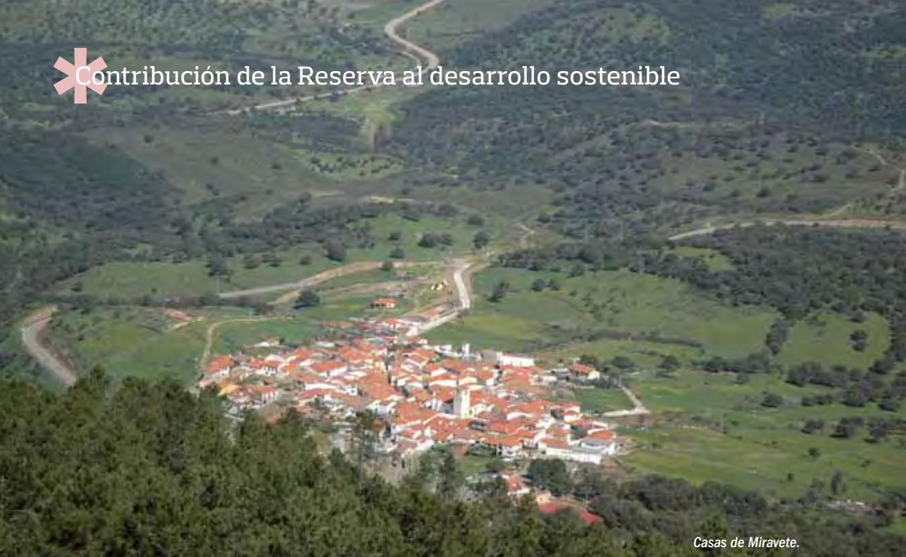
Casas de Miravete.