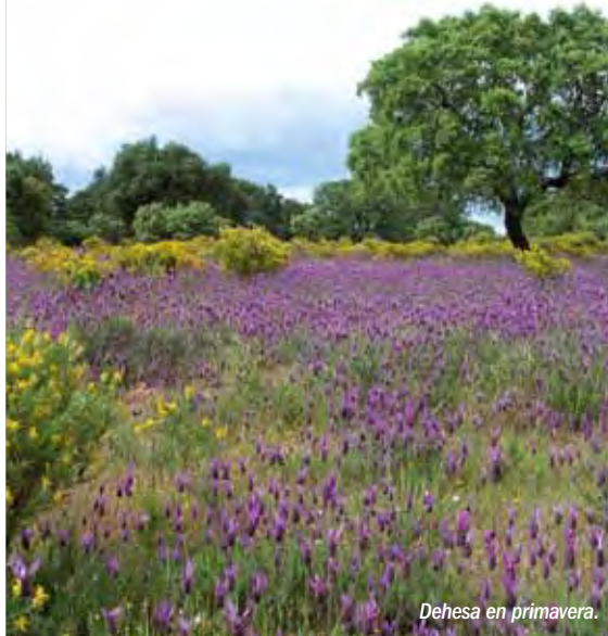
Dehesa en primavera.

La zona de transición está escasamente poblada (en su interior se encuentran cinco núcleos de población con algo más de 3.000 habitantes), predominando los sistemas adeshados, explotaciones en extensivo, fundamentalmente ganaderas, forestales y cinegéticas.