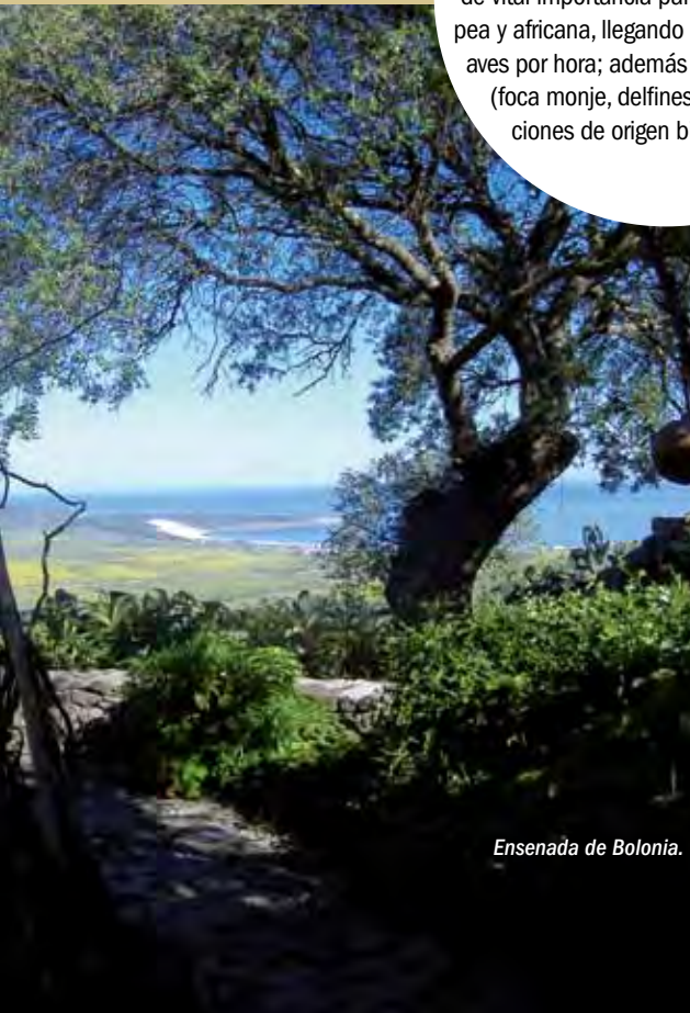
Ensenada de Bolonia.