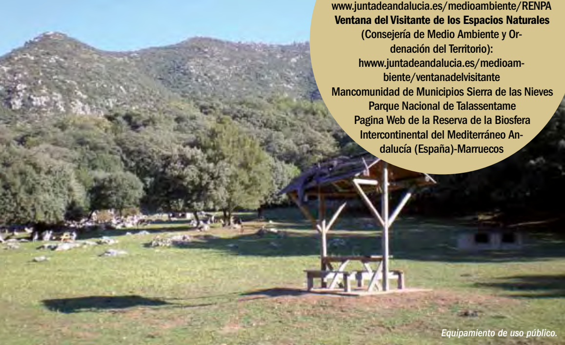
Equipamiento de uso público.

Página Web de la Reserva de la Biosfera Intercontinental del Mediterráneo Andalucía (España)-Marruecos