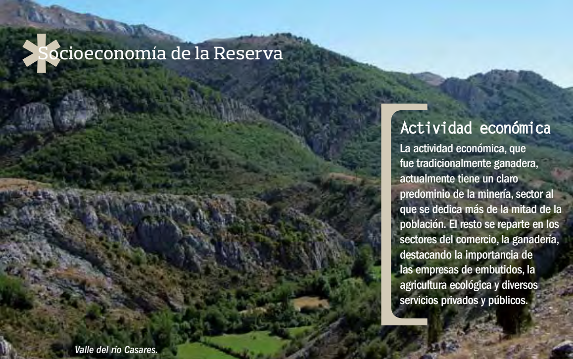
Valle del río Casares.