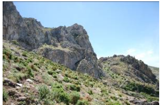
Sierra Cabrilla Tajos del Pilar

Por todo ello la Mancomunidad de Municipios Sierra de las Nieves puso en marcha un proyecto cofinanciado por la Fundación Biodiversidad para la realización de los oportunos estudios sobre la Biodiversidad y los Hábitat de las sierras Prieta y Cabrilla y los ríos Grande y Turón. Como resultado de tales estudios, elaborados en colaboración con los departamentos de Biología Animal y Vegetal de la Universidad de Málaga, se ha procedido a tramitar, por parte de la Mancomunidad de Municipios y ante la Consejería de Medio Ambiente de la Junta de Andalucía, la solicitud de declaración de estos espacios como Lugares de Importancia Comunitaria (LIC).