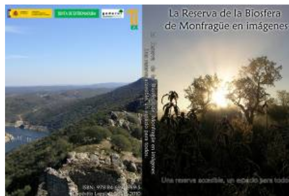
Monfragüe. Portada del audiovisual accesibilidad

La difusión de la Reserva también ha consistido en la elaboración de una exposición cartográfica con imágenes satelitales de alta resolución espacial, tanto del territorio que enmarca como de sus principales ecosistemas. Especialmente innovador ha sido la realización de un audiovisual de la Reserva donde se muestran distintas imágenes de los pueblos, los ecosistemas, la flora, la fauna, las infraestructuras, el patrimonio y la educación ambiental como referentes de la misma.