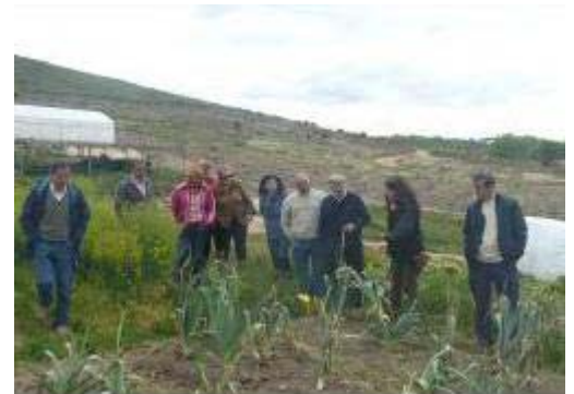
Jornadas de puertas abiertas del Centro de Zahoz

- Centro Zahoz ( http://www.centrozahoz.org ): este centro tiene como principales objetivos, la recuperación de las variedades de cultivo tradicionales del territorio RBSBF, así como su investigación, difusión y multiplicación para ponerlas de nuevo en valor y en uso en nuevos cultivos y explotaciones.