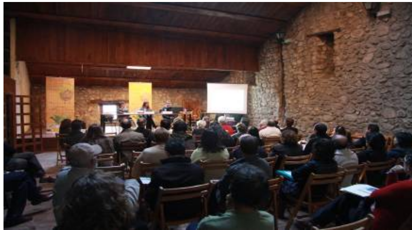
Jornada informativa del consejo de participación de la Reserva de la Biosfera de las Sierras de Béjar y Francia

Durante los meses de noviembre y diciembre se han realizado encuentros con los sectoriales: turístico; ganadero, agrícola y forestal; industrial y empresarial; asociativo; y de las administraciones locales. En estos encuentros se han identificado una serie de voluntarios que crearán las mesas de trabajo sectoriales donde se recogerán las propuestas que serán trasladadas al consejo de participación.