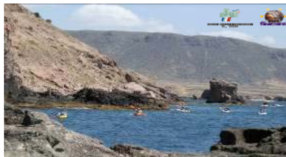
“Geología en Acción” Ruta en piragua guiada por la acantilada de Loma Pelada

Como cierre a esta intensa semana, con las dunas y azufafos de Torregarcía de escenario, se organizó una prueba de iniciación a la orientación en la que los participantes pudieron disfrutar de una actividad al aire libre donde la capacidad para interpretar los planos resulta imprescindible. Se concluyó con la actividad Geología en Acción, que contó con rutas de senderismo, en barco y en piragua, y práctica de la modalidad acuática snorkel , por algunos de los puntos más espectaculares de la costa de la Reserva de la Biosfera. Esta actividad estuvo guiada por profesionales formados en interpretación geoturística que han participado en cursos impartidos por técnicos de la Reserva.