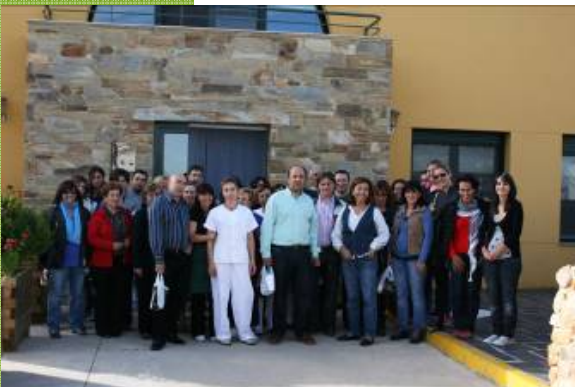
Visita a una cooperativa agroalimentaria formada por mujeres en Tabuyo del Monte