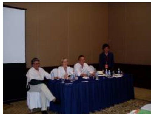
Cátedras UNESCO. Reunión temática MaB sobre Cátedras UNESCO, México 2010

Entre las conclusiones se destaca que la principal función de las cátedras UNESCO es la documentación, sistematización y difusión de experiencias exitosas entre las reservas de biosfera, así como la facilitación de comunicación e intercambios técnicos entre los gestores de reservas. En esta línea, la Red de Cátedras vinculadas con reservas de biosfera elaborará un plan de trabajo conjunto para dirigir una serie de acciones. Se