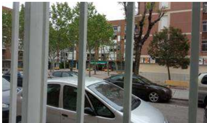
Lejos de cualquier Reserva de la Biosfera Barrio de los Descubridores. Leganés. Madrid.

Estas pueden ser las vistas desde cualquier casa de una gran ciudad, ¿qué ves desde tu ventana? ¿qué diferencias observas?